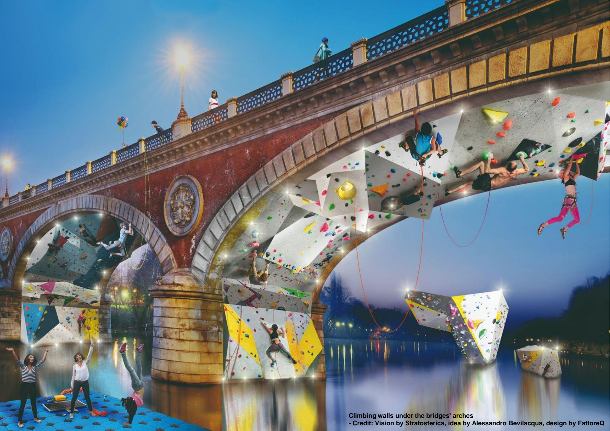
Climbing walls under the bridges' arches - Credit: Vision by Stratosferica, idea by Alessandro Bevilacqua, design by FattoreQ